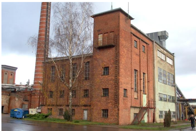
Zdjęcie nr 22. Zespół fabryki mebli i krzesel, ob. Fabryka mebli Kloze, ul. Fabryczna 1, Gościcino

Osada Gościcino z roku 1600 r. występowała pod nazwami: Gossen, Gościcino, Goszczino, Gostentin i należała do wielkiego kompleksu dworskiego Bolszewo. W XIX w. powstały sprzyjające warunki dla rozwoju przemysłu takie jak: budowa szosy Gdańsk - Wejherowo - Lębork, kolej żelazna Gdańsk - Wejherowo - Lębork, dogodne połączenie z portem w Gdańsku, liczne lasy liściaste gwarantujące dostępność surowca, tania siła robocza. W 1899 r. z fabryki celulozy, powstała fabryka mebli - największy zakład przemysłowy w powiecie wejherowskim. Pod wodzą prezesa von Gosslera powstała w Gościcinie Fabryka Krzesel. Od 1901 r. fabryka przechodziła kolejne zmiany nazwy i zarządzających firmą. W 1902 r. ukończono budowę kanału i śluzy, halę maszyn, tartaku, komina fabrycznego (wys. 50 m) i 25 metrową wieżę ciśnień. W 1907 r. miał miejsce wielki pożar, w wyniku którego prawie wszystkie obiekty wraz z parkiem maszynowym zostały zniszczone. W 1909 r. wybudowano osiedle dla robotników oraz budynek szkolny. W kolejnym roku powstał dom mieszkalny dyrektora, w wykonaniu luksusowym - pałacyk, który obecnie pełni funkcję przedszkola (ul. Fabryczna 5). W latach kolejnych rozbudowywano zespół. W latach 1994 - 1996 nastąpiła prywatyzacja zakładu. W tym czasie udziały zakładu zostały nabyte przez firmę Karl - Heinz Kloze Herzlake. Wybudowana została nowoczesna hala.