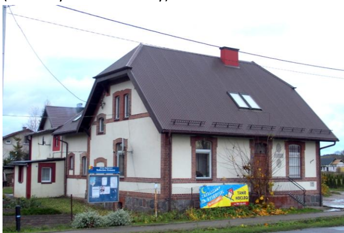
Zdjęcie nr 19. Dawna poczta, ob. budynek mieszkalny, ul. Wejherowska 19 w Kniewie