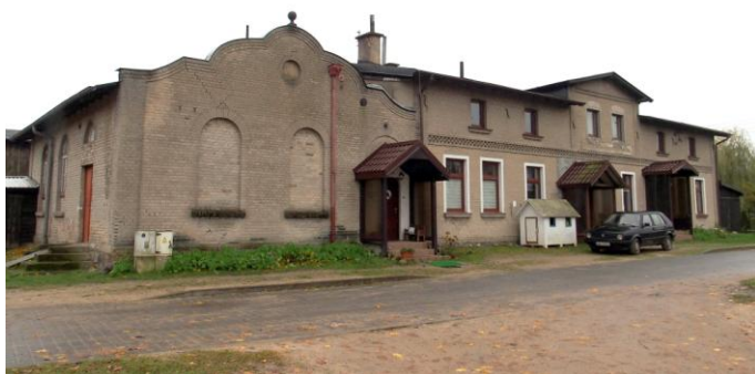
Zdjęcie nr 18. Karczma z salą taneczną, ob. budynek mieszkalny, ul. Księdza Felskiego 7 w Górze