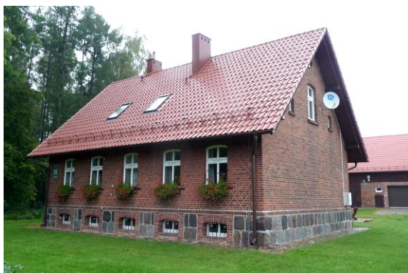
Zdjęcie nr 15, Leśniczówka, ul. Dębowa 15 w Łężyce

Leśniczówki (kwalifikowane również jako obiekty mieszkalne) - Bolszewo, Os. Miga 2, Gniewowo, ul. Cystersów 22, ul. Spacerowa 25, ul. Wejhera 2, Kąpino, ul. Osada Leśna 6., Łężyce, ul. Dębowa 15, Orle, ul. Szkolna 27, Warszkowo, ul. Piaśnicka 2-4.