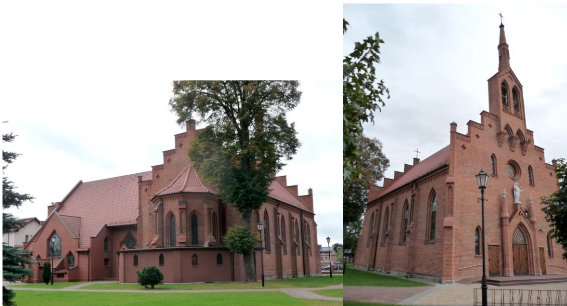
Zdjęcia nr 2, 3. Kościół parafialny pw. Wniebowzięcia NMP, ul. Główna w Bolszewie