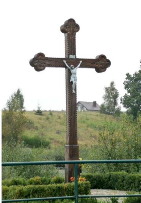
Zdjęcie nr 10. Krzyż, ul. Kamienna w Zbychowie