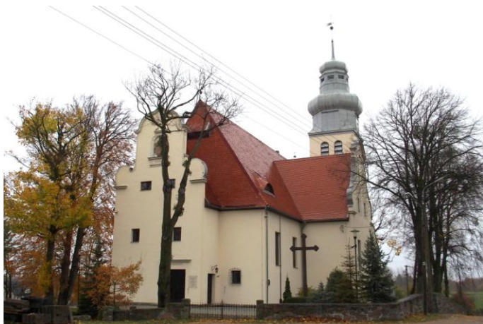
Zdjęcie nr 1. Kościół parafialny pw. Św. Mateusza Apostoła, ul. Księdza Felskiego w Górze