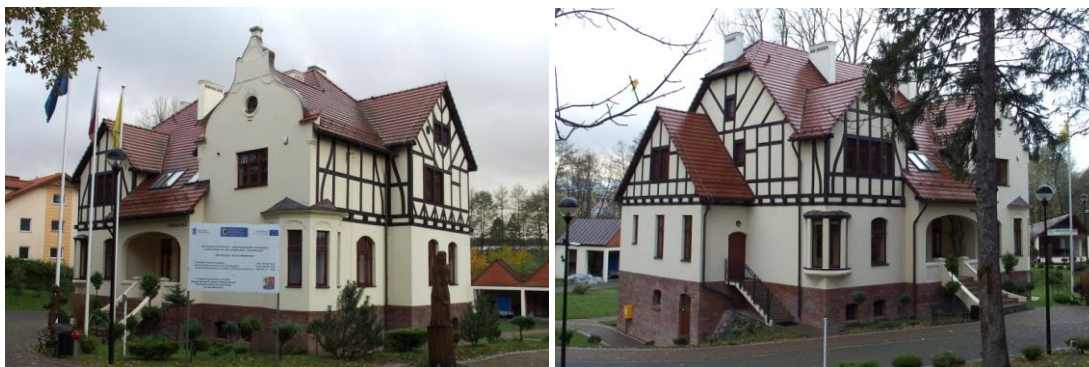
Zdjęcia nr 23, 24. „Dworek Drzewiarza”, ul. Drzewiarza 2 w Gościnnie