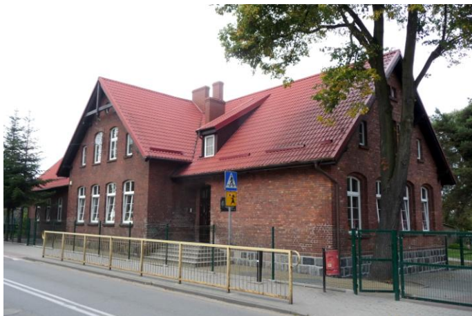
Zdjęcie nr 14. Szkoła, ul. Szkolna 11 w Bolszewie

Szkoły wiejskie - Bieszkowice, ul. Szkolna 4 (ob. budynek mieszkalny), Bolszewo, ul. Szkolna 11, Gniewowo, ul. Spacerowa 2, Góra, ul. Księdza Felskiego 3 (ob. budynek mieszkalny), Łężyce, Al. Parku Krajobrazowego 22 (ob. budynek mieszkalny), Reszki nr 18, Zbychowo, ul. Spacerowa 2 (ob. budynek mieszkalny).