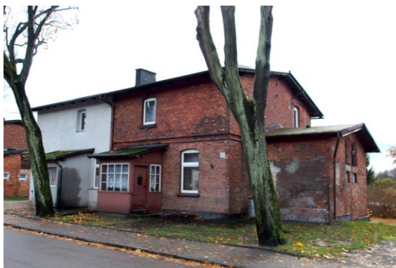
Zdjęcie nr 21. Budynek mieszkalny w zespole domków robotniczych w Gościnie, ul. Drzewiarza 26

Zespół domków robotniczych usytuowany jest po obu stronach ul. Drzewiarza. Złożony jest z jedenastu, jednorodnych obiektów mieszkalnych, które powstały w 1909 r. dla pracowników fabryki mebli i krzesel. Jest to jeden z nielicznych zachowanych przykładów budownictwa robotniczego na wsi z pocz. XX w. Wpisany jest do rejestru zabytków.