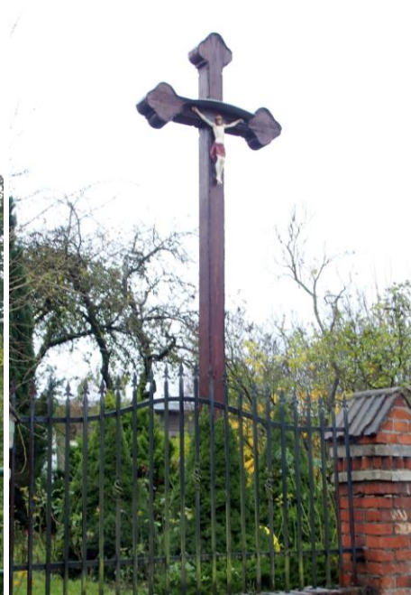
Zdjęcie nr 11. Krzyż, ul. Felskiego, Góra