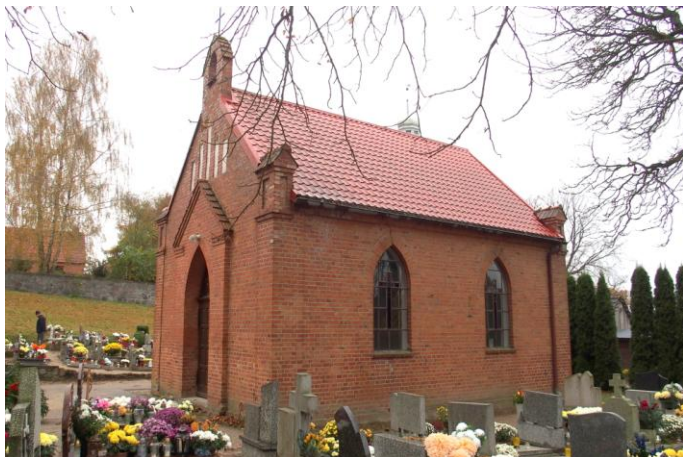
Zdjęcie nr 4. Kaplica cmentarna, ul. Wiejska w Górze

Neogotycka kaplica cmentarna, wzniesiona pod koniec XIX w. Jej niewielka bryła nakryta dwuspadowym dachem, o ceglanych elewacjach i zachowanej stolarce drzwiowej, związana jest kompozycyjnie z osiowym założeniem cmentarza, pochodzącego z tego samego czasu.