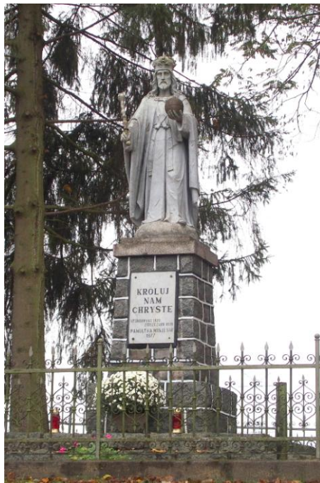
Zdjęcie nr 6. Pomnik Chrystusa Króla, u I. Wiejska w Górze

Kapliczki murowane - z wnękami. Prostopadłościennie, dwupoziomowe: część górna węższa, nakryta prostopadłymi do siebie daszkami dwuspadowymi. Wnęki arkadowe, przeszklone. W narożach u nasady - wzmocnienia w formie zaoblonych głązów.