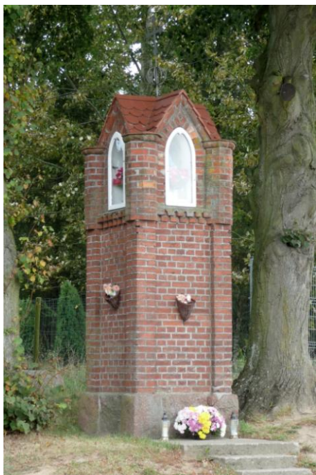
Zdjęcie nr 7. Kapliczka, ul. Kaszubska-Starowiejska w Gowinie

Kapliczki murowane - z wnękami. Prostopadłościennie, dwupoziomowe: część górna węższa, nakryta prostopadłymi do siebie daszkami dwuspadowymi. Wnęki arkadowe, przeszklone. W narożach u nasady - wzmocnienia w formie zaoblonych głązów.