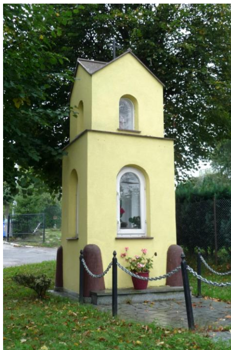
Zdjęcie nr 8. Kapliczka, ul. Wejherowska-Szkolna w Nowym Dworze Wejherowskim