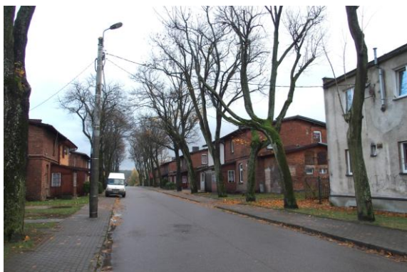
Zdjęcie nr 20. Zespół domków robotniczych w Gościnie, ul. Drzewiarza