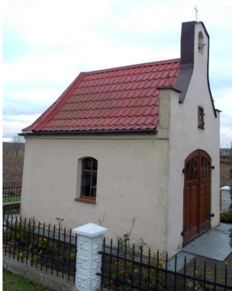
Zdjęcie nr 9. Kaplica, ul. Wejherowska w Kniewie

Kapliczka domkowa - kapliczka przydrożna, otynkowana, zamknięta drewnianymi drzwiami. Po bokach znajdują się niewielkie okna. W szczycie znajduje się niewielka nisza, w której umieszczono figurę św. Józefa. Całość jest przykryta dwuspadowym dachem.