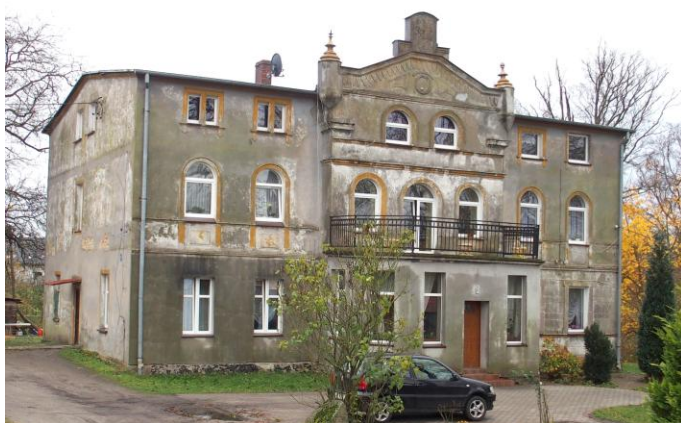
Zdjęcie nr 13. Dwór w Kąpinie, ul. Napierały 2