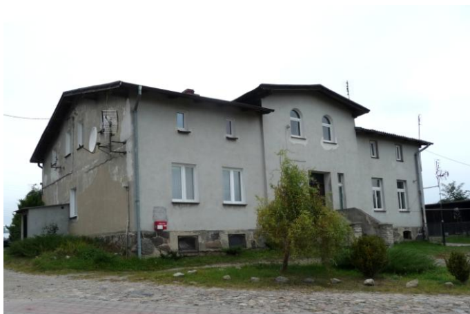
Zdjęcie nr 12. Dwór w Gowinie, ul. Kościelna 4

Rozdrobienie własności ziemskiej znalazło wyraz w ukształtowaniu siedzib szlacheckich na terenie gminy Wejherowo. Zachowane obiekty prezentują dosyć skromne, chociaż staranne formy architektoniczne, zazwyczaj łączone z formowaną zielenią. W 1 poł. XIX w. występował typ dworu charakteryzujący się parterową bryłą, bardzo często z piwnicami o sklepieniach typu kolebkowego, wspartych na arkadowych łękach, o kompozycji elewacji nawiązujących do form klasycystycznych (Bolszewo ul. Parkowa 2, Łężyca ul. Świerkowa 4). Pod koniec XIX w. popularny stał się bardziej okazały typ 1,5 lub 2-kondygnacyjny, z główną osią podkreśloną wyższym, zazwyczaj pozornym ryzalitem, zwieńczonym szczytem trójkątnym (Łężyca, Al. Parku Krajobrazowego 45, Gowino ul. Kościelna 4, Ustarbowo i Warszkowo, ul. Spokojna 12 po przebudowie,) lub neostylowym (Kąpino, ul. Napierały 2). Dwory budowane na pocz. XX w. prezentowały bardziej zróżnicowane formy. Z jednej strony były to budowle o charakterze letniej rezydencji jak wzniesiona w konstrukcji szkieletowej z secesyjnym wystrojem, zachowana w Górze, z drugiej strony siedziby kilkakrotnie przebudowywane, obecnie bez określonej formy stylowej (Pętkowice nr 12).