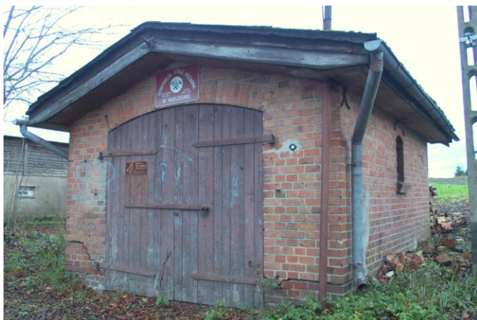
Zdjęcie nr 17. Remiza strażacka, ul. ul. Piaśnicka przy nr 17 w Warszkwie