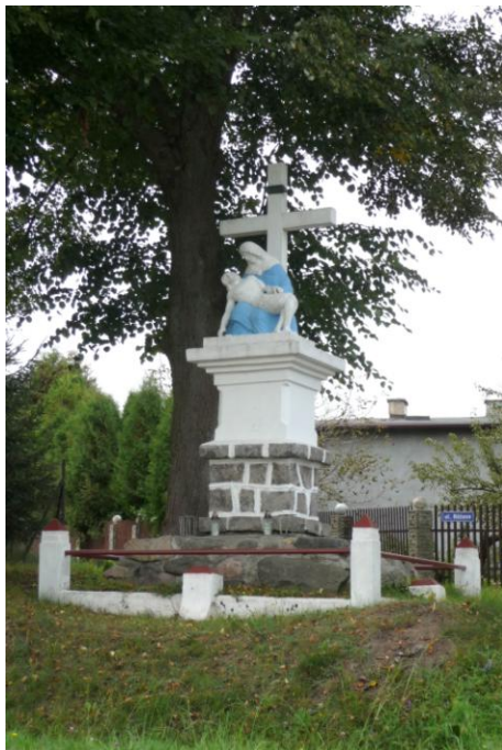
Zdjęcie nr 5. Kapliczka Pieta ul. Wejherowska w Gowinie