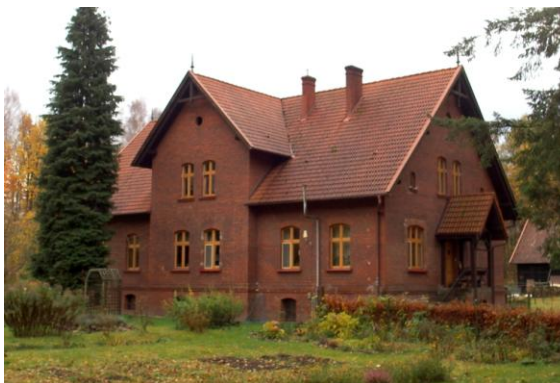
Zdjęcie nr 16. Leśniczówka, ul. Wejhera 2 w Gniewowie