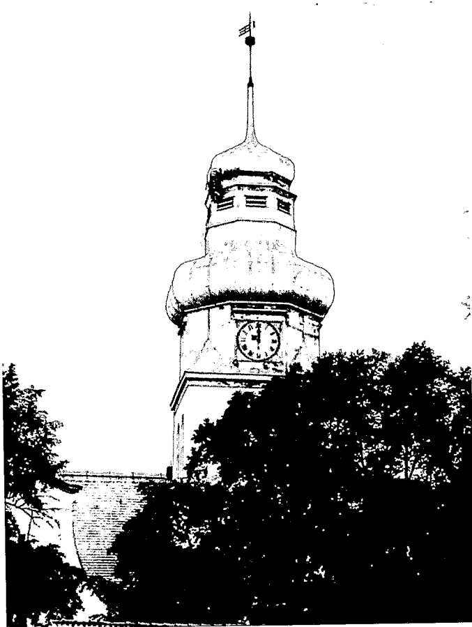
„Kopuła wieży kościoła w Górze - 2019 r.